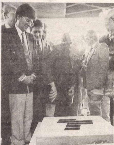
Budaörsön október 16-án ünnepélyesen lerakták a Közép-Európa legnagyobb bevásárlóközpontjának az alapkövét. Az ünnepségen jelen volt Habsburg Ottó, a Páneurópai Unió elnöke is. A képen: Habsburg Ottó az alapkövetélnél.

Ugyancsak szerdán jelentették be, hogy a svájci Richard Ernst professzor nyerte el az idei kémiai Nobel-díjat. A Svéd Királyi Akadémia indoklása szerint az ugyancsak 58 éves svájci tudós a nagy felbontású mágneses magrezonancia spektroszkópiai módszertanának kifejlesztéséhez, így a kémiában nélkülözhetetlen spektroszkópiai műszerek érzékenységének és felbontóképességének növeléséhez járult hozzá igen számottevő mértékben.