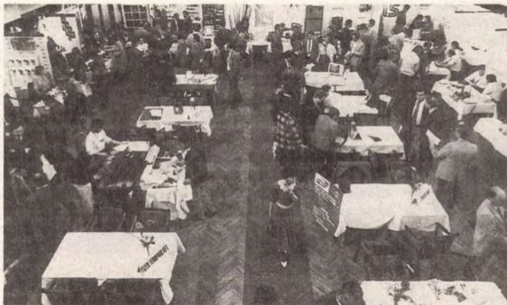
A tavaszi bemutatkozó igazán sikeres volt

Debrecen (HBN) — A Kölcsey Ferenc Művelődési Központ és a Partner Kft. másfél évvel ezelőtt, 1990 májusában rendezte meg először Debrecenben a vállalkozók kiállításával egybekötött bemutatkozóját. Noha a szervezők ötlete — rendszeressé tenni egy olyan találkozót, amelyen elsősorban a kelet-magyarországi térség kisvállalkozói, átalakuló nagyvállalatai, szövetkezetei bemutatkozhatnak, ápolhatják üzleti kapcsolataikat — jónak tűnt, az indulás mégis csak mérsékelt sikert hozott. A kezdeményezők azonban nem adták fel, és bízták abban, hogy a gazdasági átrendezés hosszabb távon igazolni fogja a regionális találkozók létjogosultságát, idén tavasszal másodszer is megrendezték a bemutatkozót. Az idő — úgy tűnik — őket igazolta, hiszen a folytatás jól sikerült, és október 24–26. között harmadszor is megnyílnak az Aranybika Szálló Bartók Termének ajtaja a vállalkozók előtt. A szervezők és a későbbiekben esetleg rendezvényeik szponzoraként, vagy a különféle kulturális alapítványok támogatójaként segítik az intézmény munkáját és általa a város, a megye kulturális életét.