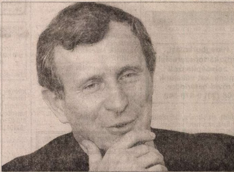
Járai Zsigmond: Reális cél jövőre az 5 százalékos gazdasági növekedés

– A jövő évi költségvetésben 11 százalékos inflációval számolunk, de ha szerencsénk lesz, akkor év végére egy számjegyre is lehet a pénzromlás üteme. Ehhez képest kell nézni a 13-14 százalékos nyugdíjmelést. Egyébként