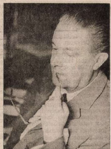
Országh László

Márpedig a magyar gazdaság 75 százalékosan kötődik az EU-hoz és csupán 5 százalékosan az orosz piacra. Talán meglepő, de Oroszország gazdasági szerepe a világban minimális, a belga gazdaság súlyához mérhető. Problémát az okozhatna, ha az orosz történelemből egy komolyabb világgazdasági válság bontakozna ki. Ennek azonban egyelőre semmi jelét nem látjuk – fogalmazott Járai Zsigmond.